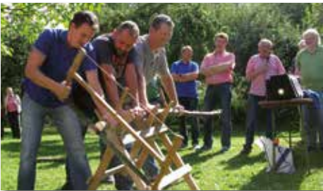
Gewinner beim Sägewettbewerb am Herbstfest