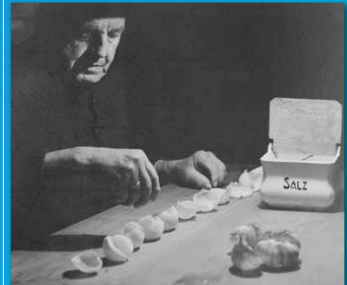
Wettervorhersage in der Heiligen Nacht – 24./25. Dezember mit Salz in 12 Zwiebelschalen für die Monate des neuen Jahres