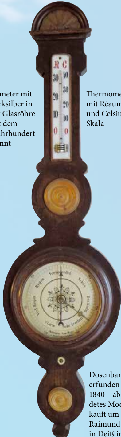
Thermometer mit Réaumur und Celsius-Skala