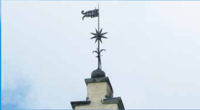
Blitzableiter auf dem Kirchturm Mühlhausen seit 1877...

Benjamin Franklin erfand 1752 den Blitzableiter. Eisenstangen mit vergoldeter Spitze (gegen Rost) sollen den elektrischen Blitz-Strom „fangen“ und in die Erde leiten.