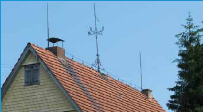
...und auf einem Bauernhaus in Oberbaldingen

Giebelverkleidungen als Wetterschutz mit verschiedenen Materialien: