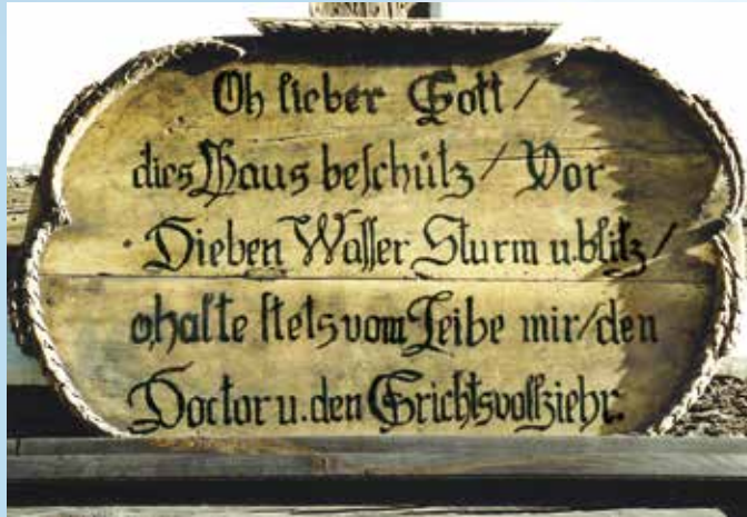
Hausinschrift an einem alten, abgegangenen Bauernhaus

Diese Notiz ist überliefert in der Hug'schen Chronik: