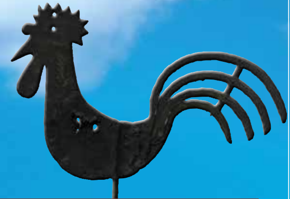
Alter Wetterhahn vom Kirchturm Mühlhausen mit Durchschüssen aus der Besatzungszeit – Mai 1945