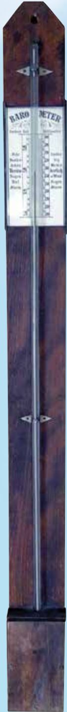
Barometer mit Quecksilber in einer Glasröhre – seit dem 17. Jahrhundert bekannt