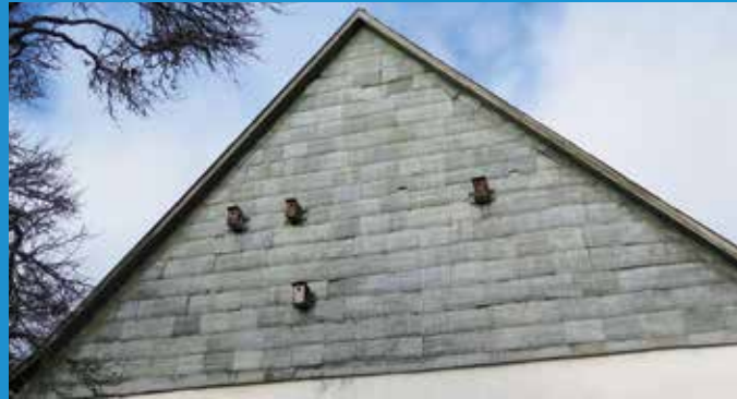
Blechtafeln an der alten Klingele-Mühle in Mühlhausen

Besuchen Sie die Sonderausstellung im Bauernmuseum Mühlhausen, Pfarrer-Mesle-Weg 1a, 78056 VS-Mühlhausen.