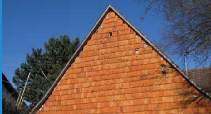
Biberschwanzziegel an einem Haus in Gunningen

Giebelverkleidungen als Wetterschutz mit verschiedenen Materialien: