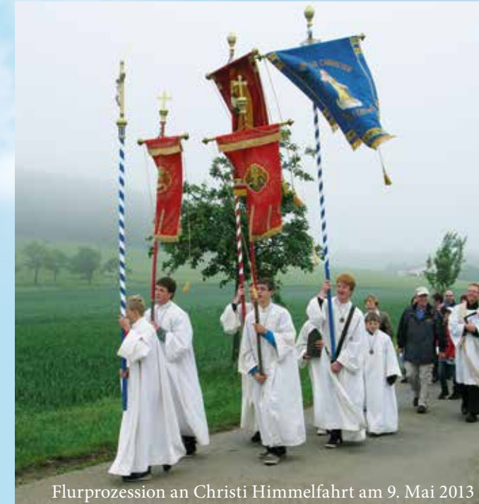
Flurprozession an Christi Himmelfahrt am 9. Mai 2013