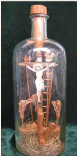
Kreuz in der Flasche, 19. Jh.