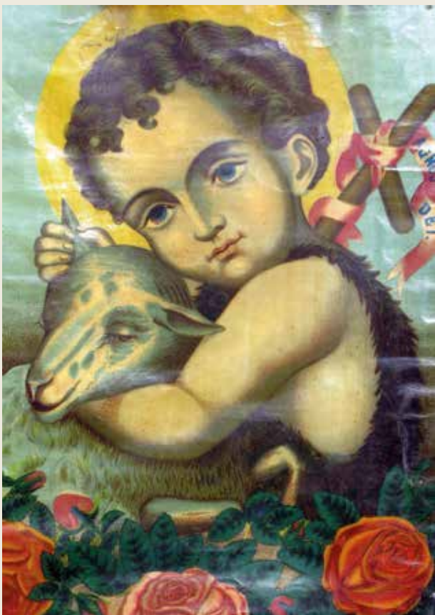
Chromolithographie Jesus – Lamm Gottes, Ende 19. Jh.