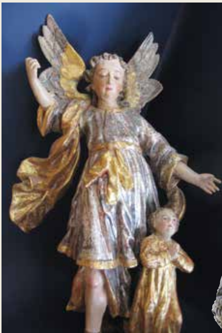
Schutzengel mit Kind, 18. Jh.