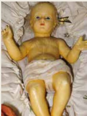
Jesuskind aus Wachs, Ende 19. Jh.